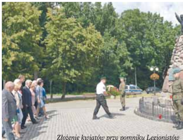
Złożenie kwiatów przy pomniku Legionistów