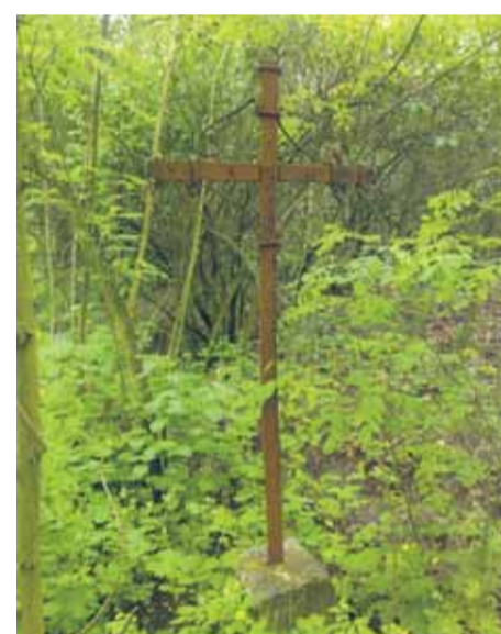
Krzyż bez tablicy ok. 2006 roku.

Cmentarz został „przywrócony pamięci” i na stałe wpisany w krajobraz kulturowy miejscowości. Najlepszym dowodem na „oswojenie” cmentarza osadników niemieckich przez mieszkańców był ich czynny udział podczas prac porządkowych. Podczas dnia Wszystkich Świętych