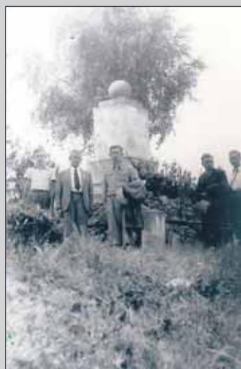
Grupa osób pod pomnikiem, lata 30