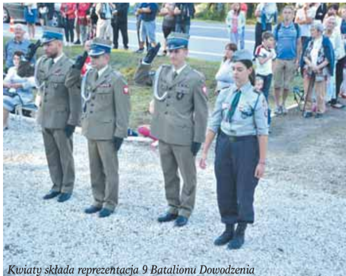
Kwiaty składa reprezentacja 9 Batalionu Dowodzenia