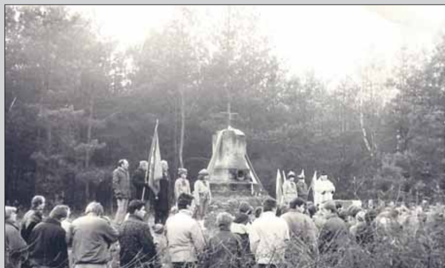
Gminne uroczystości pod pomnikiem, koniec lat 80