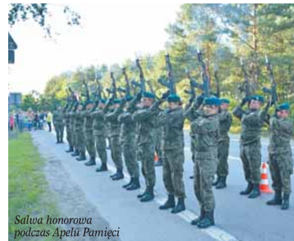
Salwa honorowa podczas Apelu Pamięci