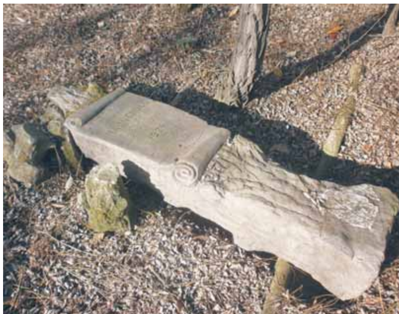
Michałów-Grabina. Nagrobek Henryka Rajnholca z 1924 roku, fot. K. Szostek