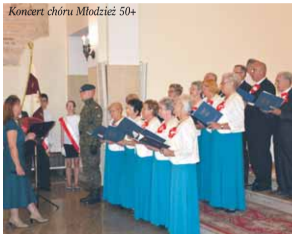
Koncert chóru Młodzię 50+