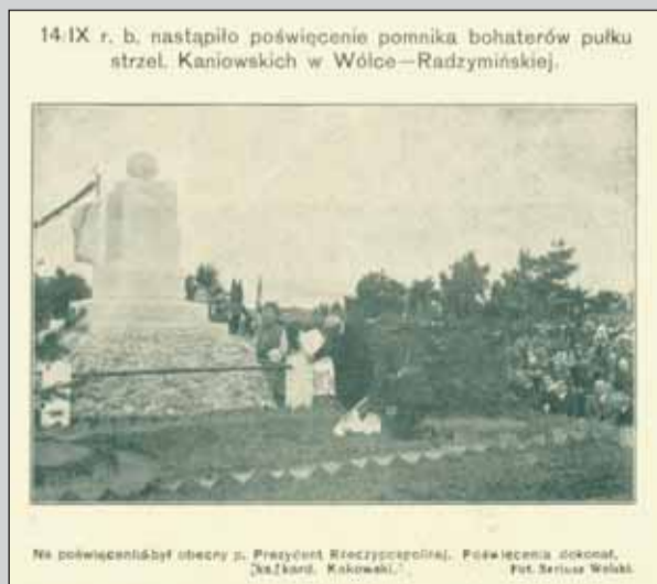
14 IX r. b. nastąpiło poświęcenie pomnika bohaterów pułku strzel. Kaniowskich w Wólce-Radzyńskiej.