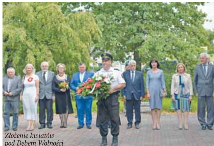
Złożenie kwiatów pod Dębem Wolności