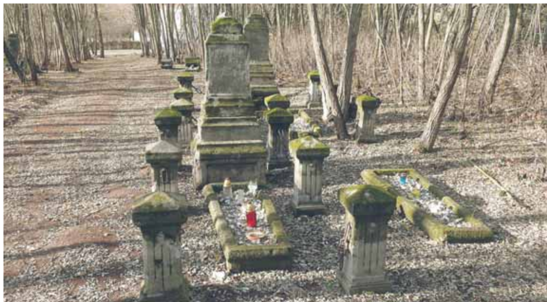
Michałów-Grabina. Wybrane groby przy alei głównej. Widok w kierunku ul. Kwiatowej, jesień 2015r.