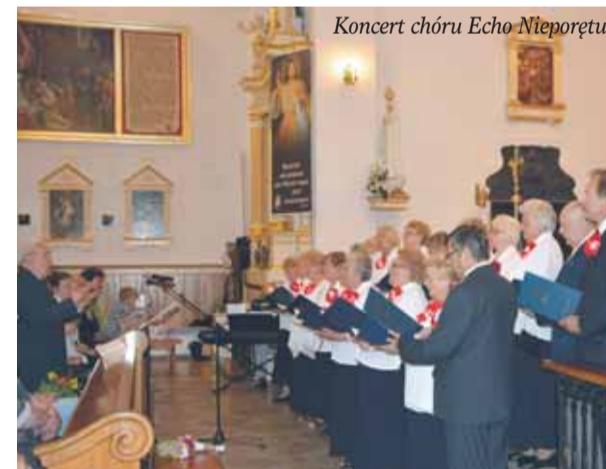
Koncert chóru Echo Nieporętu