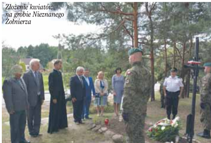
Złożenie kwiatów na grobie Nieznanego Żołnierza