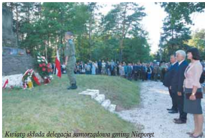
Kwiaty składa delegacja samorządowa gminy Nieporęt