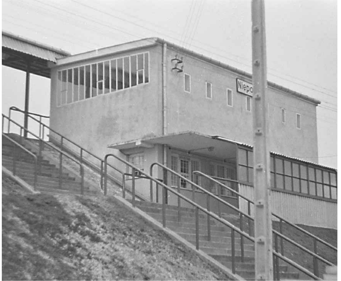
Stacja kolejowa w Nieporęciu. Lata sześćdziesiąte.

Konrad Szostek Nieporęckie Stowarzyszenie Historyczne