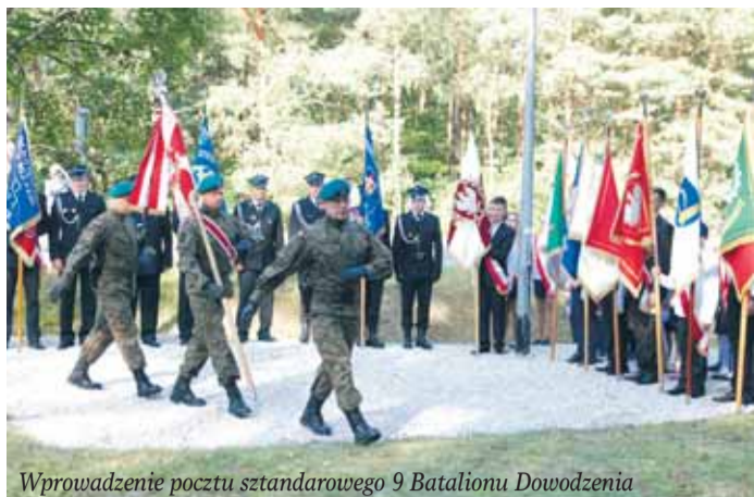
Wprowadzenie pocztu sztandarowego 9 Batalionu Dowodzenia