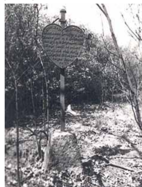
Krzyż na cmentarzu w Aleksandrowie z zachowaną tablicą żeliwną.1995 r.

i Święta Zmarłych na nekropolii płoną dziesiątki zniczy.